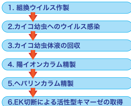
図2 発現・精製スキーム